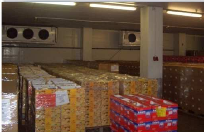
Lagerung von Milchprodukten bei 2 – 4 °C in einer Käserei